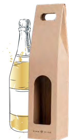
Pudełka z okienkiem