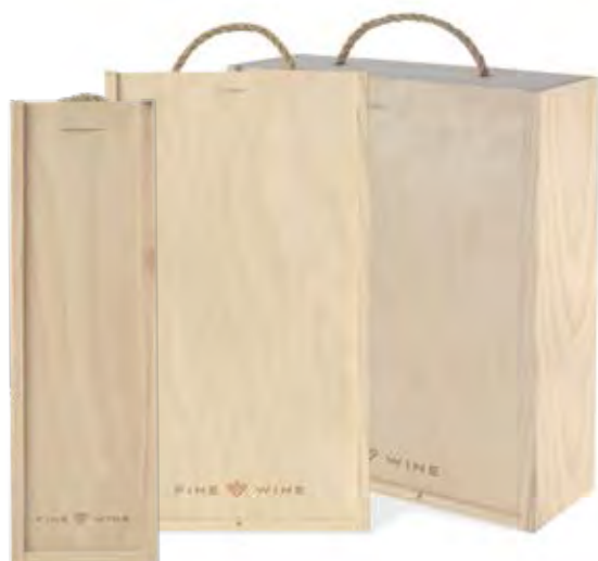
Skrzynka zasuwana / zamykana