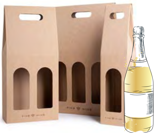
Pudełko kartonowe z okienkiem