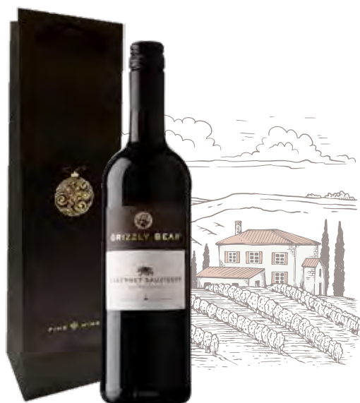
ZESTAW NR 1

Butelka wina lub wyśmienitego, mocniejszego alkoholu wraz z kieliszkami i karafką to uniwersalny zestaw, który pasuje na każdą okazję. Do wybranej butelki pomożemy również dobrać smaczne dodatki.