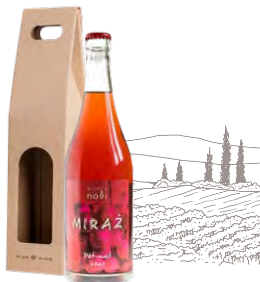
ZESTAW NR 2